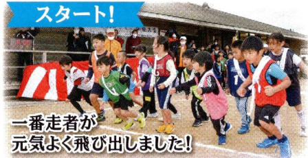
一番走者が 元気よく飛び出しました!