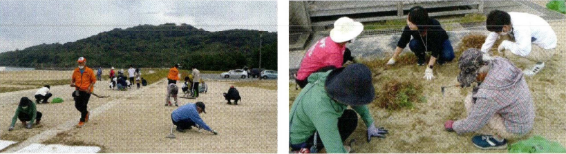
参加者の皆さん、お疲れ様でした。

皆様のおかげで200近いボランティア袋に回収出来ました。参加していただいた皆さんありがとうございました!(^^)!