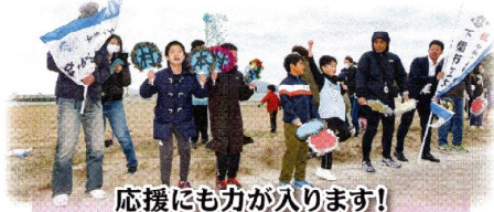
応援にも力が入ります!