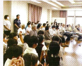
③田の首自治会の福祉講座(認知症予防)