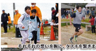
それぞれの想いを胸に、タスキを繋ぎます。