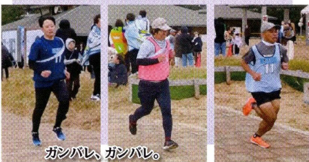
ガンバレ、ガンバレ。