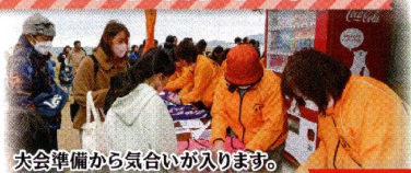
大会準備から気合いが入ります。