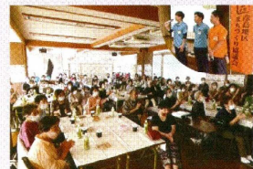
①塩浜町公民館での移動カフェ