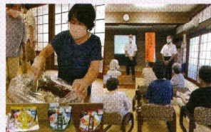
②本村町自治会の活動