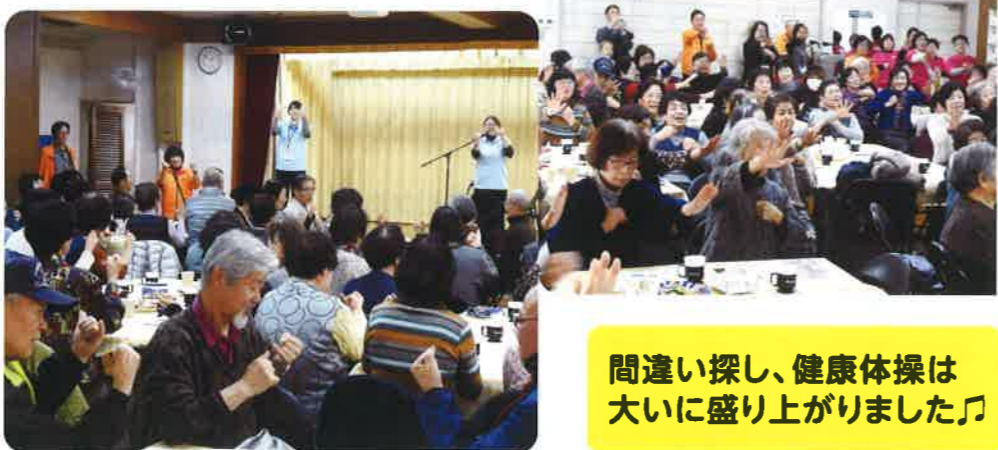
間違い探し、健康体操は 大いに盛り上がりました♪