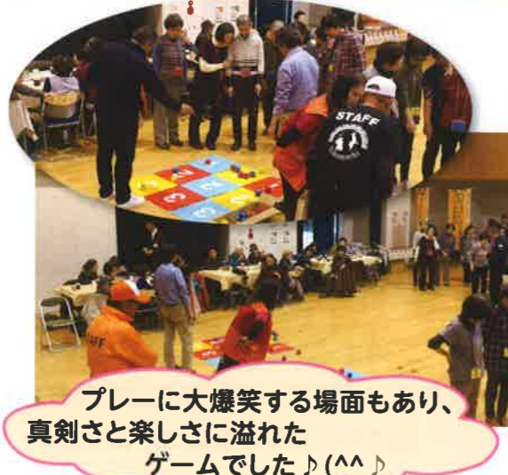
プレーに大爆笑する場面もあり、 真剣さと楽しさに溢れた ゲームでした♪(^^)