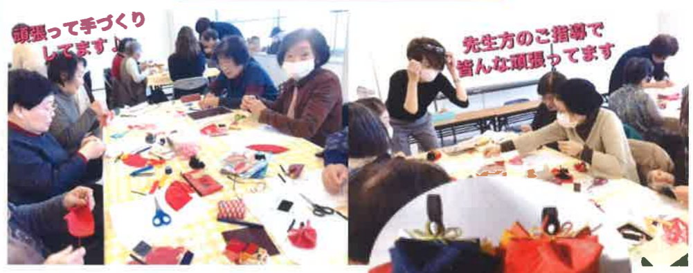
可愛いひな人形が出来ました♪