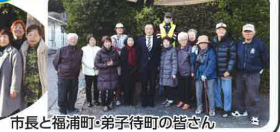
市長と福浦町・弟子待町の皆さん