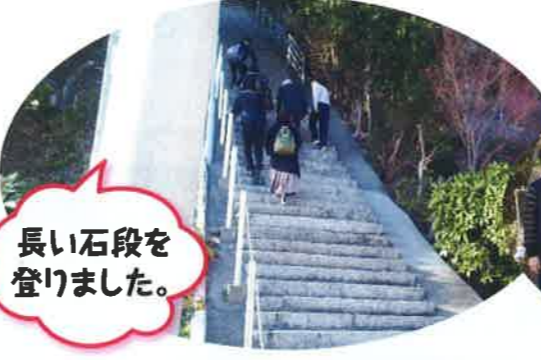
長い石段を登りました。