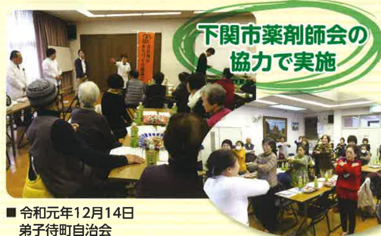
令和元年12月14日 弟子待町自治会