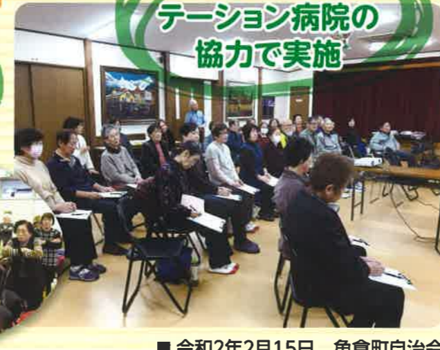
令和2年2月15日 角倉町自治会