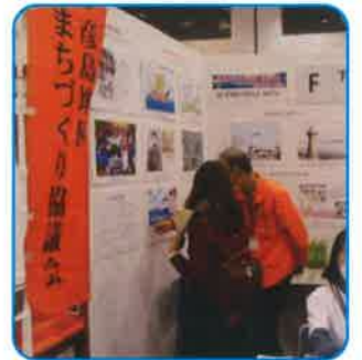
1階展示見本市会場に出展風景

日本各地の伝統や文化を国内外に発信するために、文化庁が認定している日本遺産の魅力を紹介する「日本遺産フェスティバル」が10月29、30日海峡メッセで開催されました。彦島・中東・西部・長府地区が協同で出展し、当地区は彦島の近代化・歴史遺産などの写真展示やパンフレットを配布しました。関門海峡を巡る近代化遺産は下関市に17遺産あり、そのうち4遺産が彦島にあります。