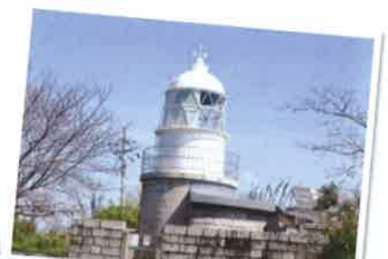
六連島灯台 六連島