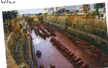
第3、4ドック (三菱下関造船所) 江の浦町