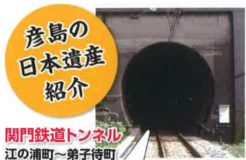
彦島の 日本遺産 紹介 関門鉄道トンネル 江の浦町～弟子待町

江戸中期～明治初期、北国と上方(大阪)を結び、海産物や米などを上方へ、酒・塩等を北国に運搬した北前船(きたまえぶね)の時代、下関は寄港地として栄えました。