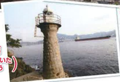
旧俎礁標 (きゆうまないた) (しょうひょう) 田の首町